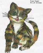
Auf vier Pfoten durchs Kirchenjahr

► Auf vier Pfoten durchs Kirchenjahr, Franz Zeiger, Waltraud & Bettina Schober, Verlag dip3, Wilhering, 2013